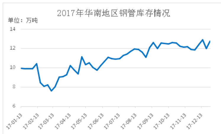
图 4：2017 年华南地区钢管库存情况

库存而言，2017 年伴随市场的好转，贸易商大批量增加，尽管资金风险加大，市场社会库存也是逐步攀升态势，如图 4；另外，17 年需求整体小幅增长，贸易商常备库存量有所增加，还有一方面，北方资源占有率提高，迫于运输压力，当地代理商补货相对及时，部分大户常备库存 2 万吨左右，出货表现良好。