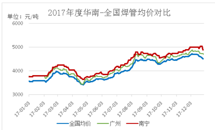
图 2：2017 年度华南-全国焊管均价对比