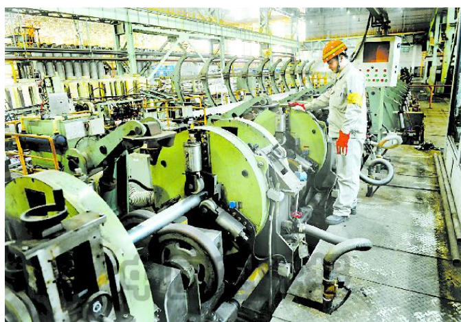
图为质检站员工通过超声波无损检测查看镍基合金管质量

为提升镍基合金管超声波检测产能，突破工序瓶颈，宝钢特钢钢管厂质检站通过完善超声波检测工艺及各工序协同等措施，在新年前两周，完成镍基合金管超声波检测量达 110 吨，同比增加了 18%，为钢管厂今年生产经营开了一个好头。