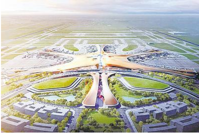
图为北京新机场航站楼效果图

外形如凤凰展翅的北京新机场航站楼渐露雏形。10月10日，尚在建设中的北京新机场迎来首次媒体开放日，媒体记者提前目睹全球最大机场航站楼绰约风姿。在凤凰展翅的背后记者了解到，截至9月，主航站楼基建工程已超60%。这当中，包钢所产无缝钢管占一期工程总用量的80%。